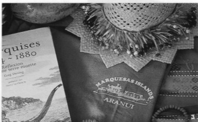
1 L'Aranui III en escale aux Marquises, en septembre dernier. 2 Une cabine de luxe située sur le sundeck. 3 Quelques souvenirs glanés à la boutique du bord. 4 Tatouage marquisien traditionnel.